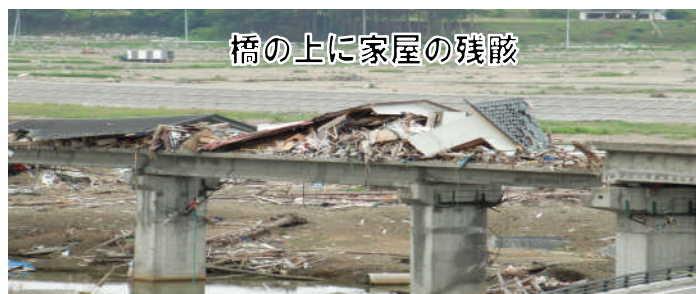
橋の上に家屋の残骸

国診協から『飲料水は持参、銀行のATMは多分使えない、現金を多めに準備』等の連絡が出発2日前に届き、東北への乗り継ぎの東京で物資を調達しました。新幹線で一関に着いてみると、町並みは静かで普段通りの生活！コンビニにも物品はほぼ十分にあり、飲料水持参の話をするので笑われました。天草から所要12時間強で到着し、翌日朝より実働開始。市民や多くのボランティアの方々の懸命の労働で、泥水にすべてが浸