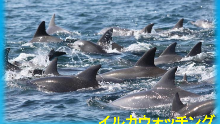
イルカウォッチング