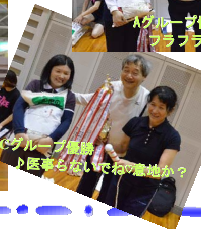
Cグループ優勝 ♪医事らないでねの意地か？