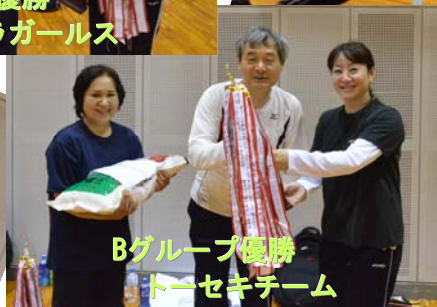
Bグループ優勝 トーセキチーム