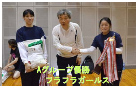
Aグループ優勝 フラフラガールズ