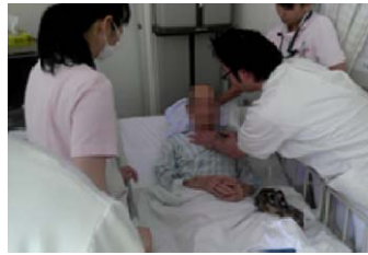
週1回の病棟回診風景

嚥下障害対策チームでは、医師・歯科医師・看護師・言語聴覚士・管理栄養士・理学療法士・作業療法士などの専門職がチームとなり、スクリーニング検査、嚥下造影検査(VF)、嚥下内視鏡検査(VE)、週1回の病棟回診やカンファレンスを行い、患者さんの状態や機能の変化に応じた最適なりハビリ訓練・指導を行っています。