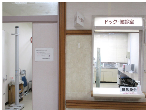
▲病院正面玄関をいって右手に院内健診の窓口があります