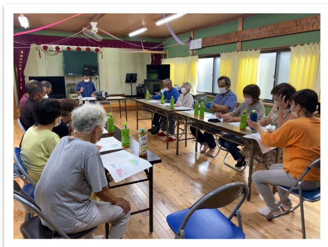
8月17日 梅の木公民館