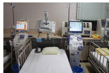
ベッドサイドの様子

欠な手術としてシャント手術やシャント不全発生時のバルーンカテーテル治療(VAIVT)も、積極的に施行しております。