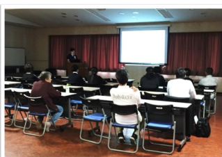
新型コロナ感染症以前の 糖尿病教室の様子

糖尿病治療の目標は「糖尿病をコントロールすることで合併症を抑え、健康的で充実した社会生活を送れるようにすること」です。そのためには患者さん自身が積極的に治療に取り組み自己管理を行うことが最も大切になります。